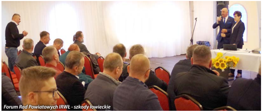
Forum Rad Powiatowych IRWL - szkody łowieckie

Stan uprawy ustala się w 5-stopniowej skali, rosnąco od 1 do 5, gdzie 1 to stan bardzo zły, 2 to stan zły, 3 to stan śred-