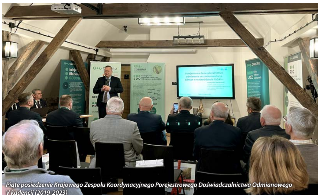
Piąte posiedzenie Krajowego Zespołu Koordynacyjnego Porejestrowego Doświadczalnictwa Odmianowego V kadencji (2019-2023)