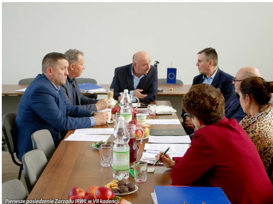
Pierwsze posiedzenie Zarządu IRWŁ w VII kadencji

zboża po drastycznie niskich cenach poniżej kosztów produkcji. Cena skupu mokrej kukurydzy na poziomie 350-400 zł/t nie pokrywa kosztów produkcji. Ceny pozostałych zbóż spadły od daty zbiorów ok 10%, obniżone plony spowodowane wystąpieniem suszy w całym regionie a do tego rażąco niskie ceny skupu zbóż mogą spowodować utratę płynności finansowej wielu gospodarstw rolnych. Ponadto rolnicy zgłaszają, że mają problem ze sprzedażą słonecznika, cena również spadła o 10%.