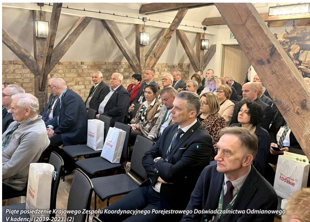
Piąte posiedzenie Krajowego Zespołu Koordynacyjnego Porejestrowego Doświadczalnictwa Odmianowego V kadencji (2019-2023) (2)

- rozporządzenia MRiRW w sprawie szczegółowych warunków i szczegółowego trybu przyznawania