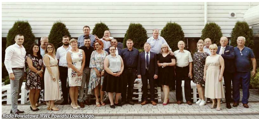
Rada Powiatowa IRWŁ Powiatu Łowickiego