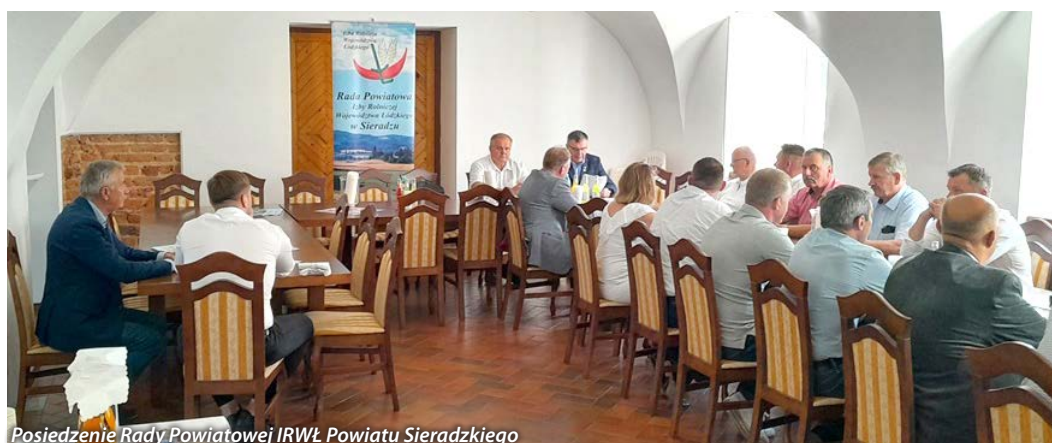
Posiedzenie Rady Powiatowej IRWŁ Powiatu Sieradzkiego

Wszystkie działania, interwencje podejmowane przez Zarząd Izby Rolniczej Województwa Łódzkiego oraz odpowiedzi na wnioski zgłoszone przez IRWŁ oraz informacje na temat sytuacji w rolnictwie są dostępne na stronie internetowej IRWŁ www.izbarolnicza.lodz.pl