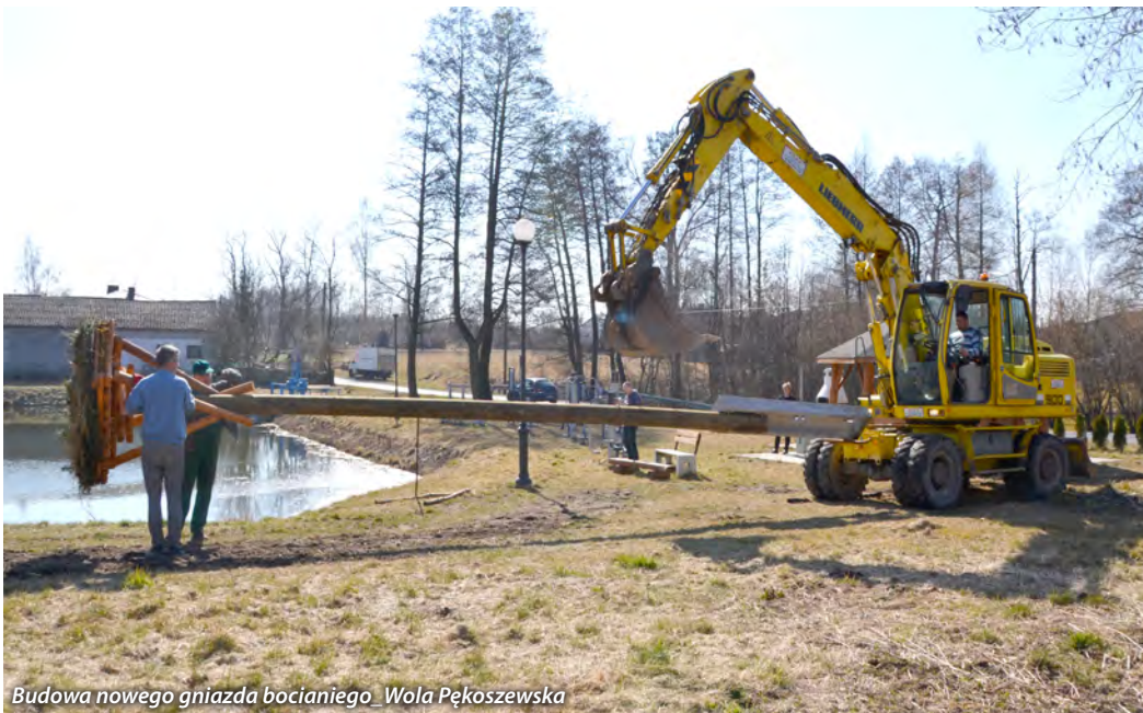
Budowa nowego gniazda bocianiego Wola Pękoszewska