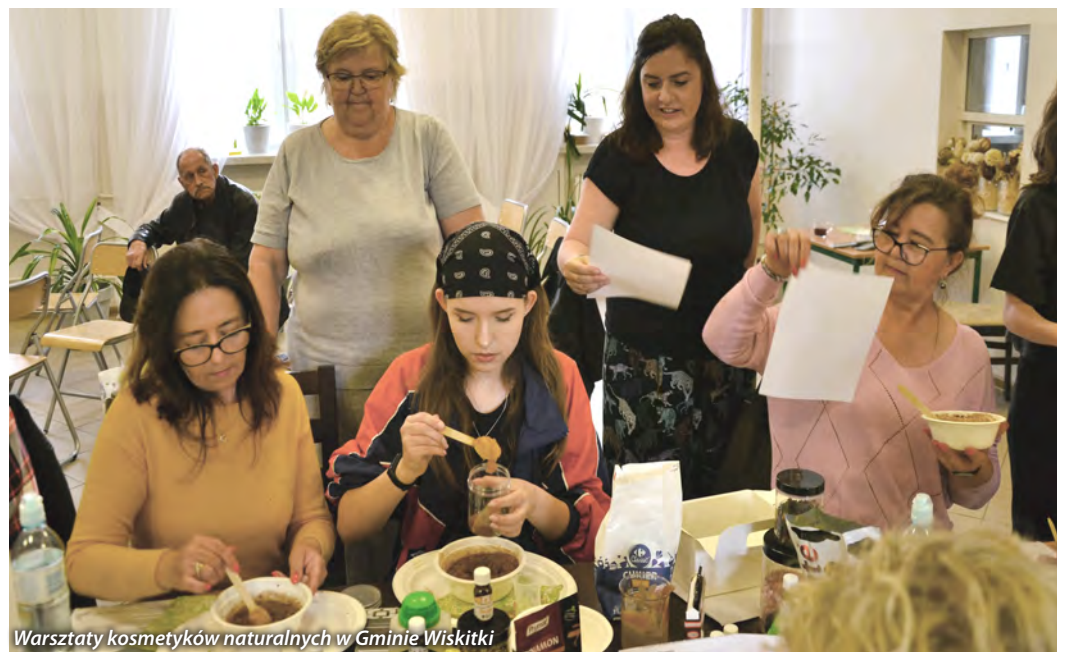
Warsztaty kosmetyków naturalnych w Gminie Wiskitki

W lipcu planujemy kolejny spływ kajakowy połączony z akcją sprzątnięcia rzeki Rawki na trasie Żydo-