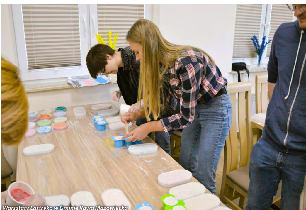
Warsztaty Lastryko w Gminie Rawa Mazowiecka

mice-Kurzeszyn. Jest to cykliczne wydarzenie, realizowane przez LGD „Kraina Rawki” od 2015 roku. Inicjatywa współfinansowana jest ze środków Gminy Rawa Mazowiecka. Chcemy zachęcić społeczność do aktywnego spędzenia czasu na łonie przyrody i jednocześnie pokazać, że rezerwat przyrody Rzeka Rawka to obszar atrakcyjny turystycznie. Wspólnie z LGD „Ziemia Chełmońskiego” i LGD „Zielone Sąsiedztwo” będziemy realizować projekt współpracy pt. „Kompetencje, Kreatywność, Kobięcość”, który ma na celu wzmocnienie kapitału społecznego, a także integrację i aktywizację społeczną kobiet na obszarze objętym przez Partnerskie LGD. Planujemy również kolejną operację własną, dzięki której zwiększymy ilość działań aktywizujących i integrujących mieszkańców obszaru LGD.