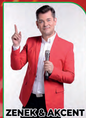
ZENEK & AKCENT