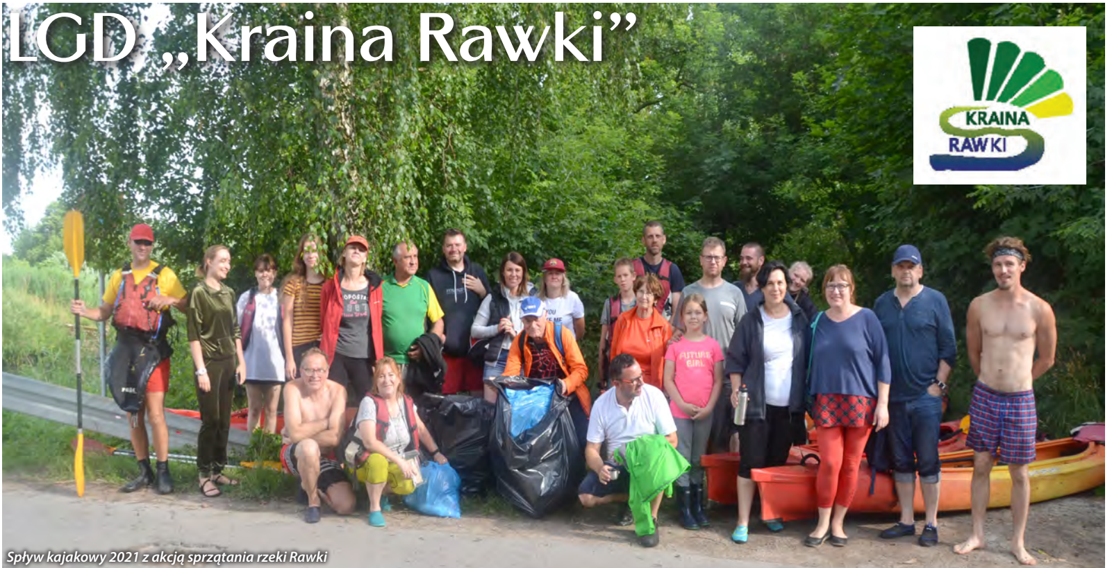
Splyw kajakowy 2021 z akcją sprzątania rzeki Rawki

Stowarzyszenie Lokalna Grupa Działania „Kraina Rawki” zostało powołane w 2006 roku. Od tego czasu nieustannie aktywizujemy społeczność lokalną do wspólnego działania na rzecz rozwoju obszarów wiejskich oraz poprawy jakości życia mieszkańców, przy wsparciu środków unijnych.