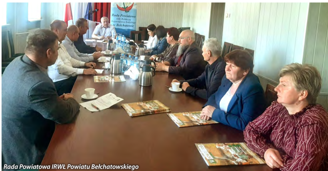
Rada Powiatowa IRWŁ Powiatu Bełchatowskiego