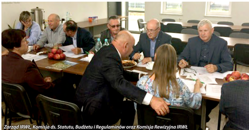
Zarząd IRWŁ, Komisja ds. Statutu, Budżetu i Regulaminów oraz Komisja Rewizyjna IRWŁ