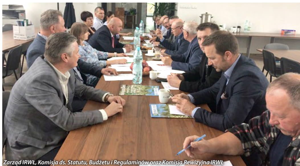
Zarząd IRWŁ, Komisja ds. Statutu, Budżetu i Regulaminów oraz Komisja Rewizyjna IRWŁ