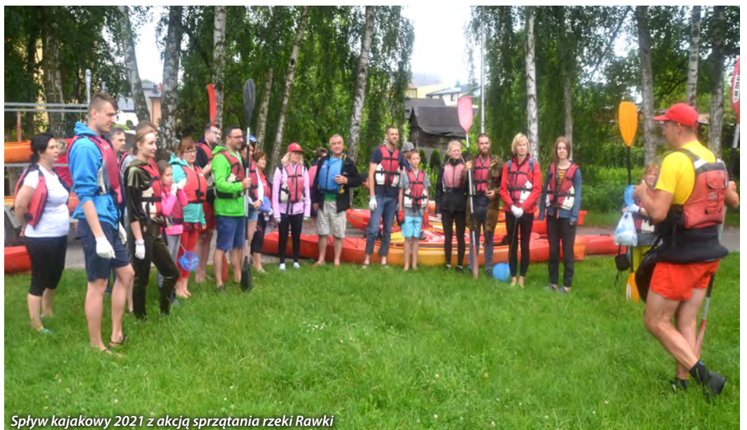
Splyw kajakowy 2021 z akcją sprzątania rzeki Rawki

Realizujemy działania na rzecz budowy społeczeństwa obywatelskiego, wspomagamy rozwój wspólnot i społeczności lokalnych poprzez wspieranie oddolnych inicjatyw mieszkańców. Od 2010 roku w ramach działania „Granty Krainy Rawki” finansowanego ze środków własnych stowarzyszenia, zrealizowaliśmy 23 nabory, dofinansowaliśmy 582 opera-