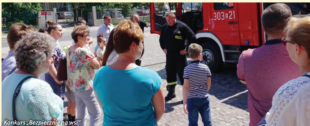
Konkurs „Bezpiecznie na wsi”