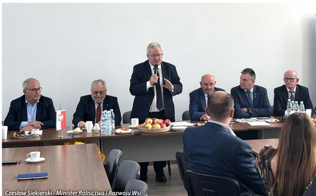
Czesław Siekierski - Minister Rolnictwa i Rozwoju Wsi

Temat braku możliwości ubezpieczenia upraw sadowniczych to kwestia, która budzi duże zainteresowanie wśród rolników oraz sadowników, szczególnie w kontekście zmian klimatycznych i ryzyka związanego z nieprzewidywalnymi warunkami pogodowymi. Jednym z głównych powodów, dla których ubezpieczenie upraw sadowniczych jest problematyczne, jest ich wysoka podatność na szkody spowodowane przez warunki atmosferyczne. Uprawy te są często narażone na przymrozki – szczególnie w okresie wiosennym, gdy drzewa owocowe są w fazie kwitnienia, co może spowodować całkowitą utratę plonów, gradobicia – mogą uszkodzić owoce i liście, a nawet zniszczyć całe drzewa, susze – niedobór wody w okresie wegetacyjnym wpływa na wzrost owoców i jakość plonów, powodzie i intensywne opady deszczu – mogą zniszczyć nie tylko same uprawy, ale także infrastrukturę rolniczą. Wszystkie te czynniki sprawiają, że ryzyko strat w przypadku sadów jest bardzo wysokie. Brak możliwości ubezpieczenia upraw sadowniczych stanowi, więc poważne wyzwanie dla rolników. Przypomniano o zasadach udzielania pomocy producentom rolnym poszkodowanym w wyniku kwietniowych przymrozków i majowego gradobicia. Rząd wykorzystał możliwość dofinansowania 37 mln euro z budżetu unijnego o 200 proc. z budżetu krajowego, co w sumie daje kwotę pomocy w wysokości około 470 mln złotych.