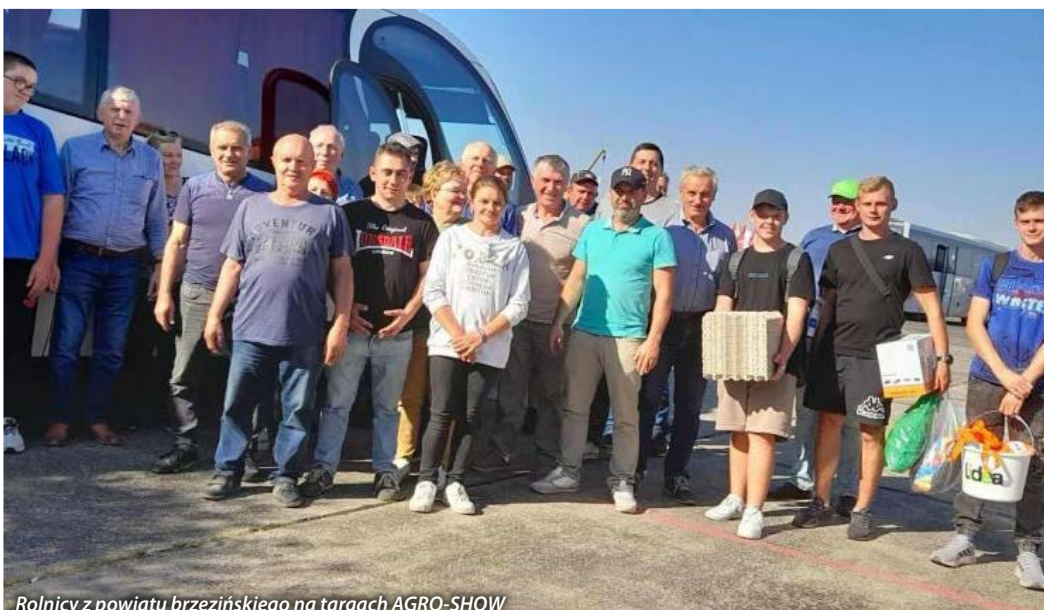
Rolnicy z powiatu brzezińskiego na targach AGRO-SHOW

2. Podjęcie działań mające na celu przyspieszenie procedur związanych z wypłacaniem wniosków suszowych. Producenci, którzy posiadają zwierzęta powinni w pierwszej kolejności mieć wypłaconą pomoc finansową. Ponadto zasadne jest, aby pomoc suszowa była wypłacana proporcjonalnie do stwierdzonej wysokości straty. Jeśli