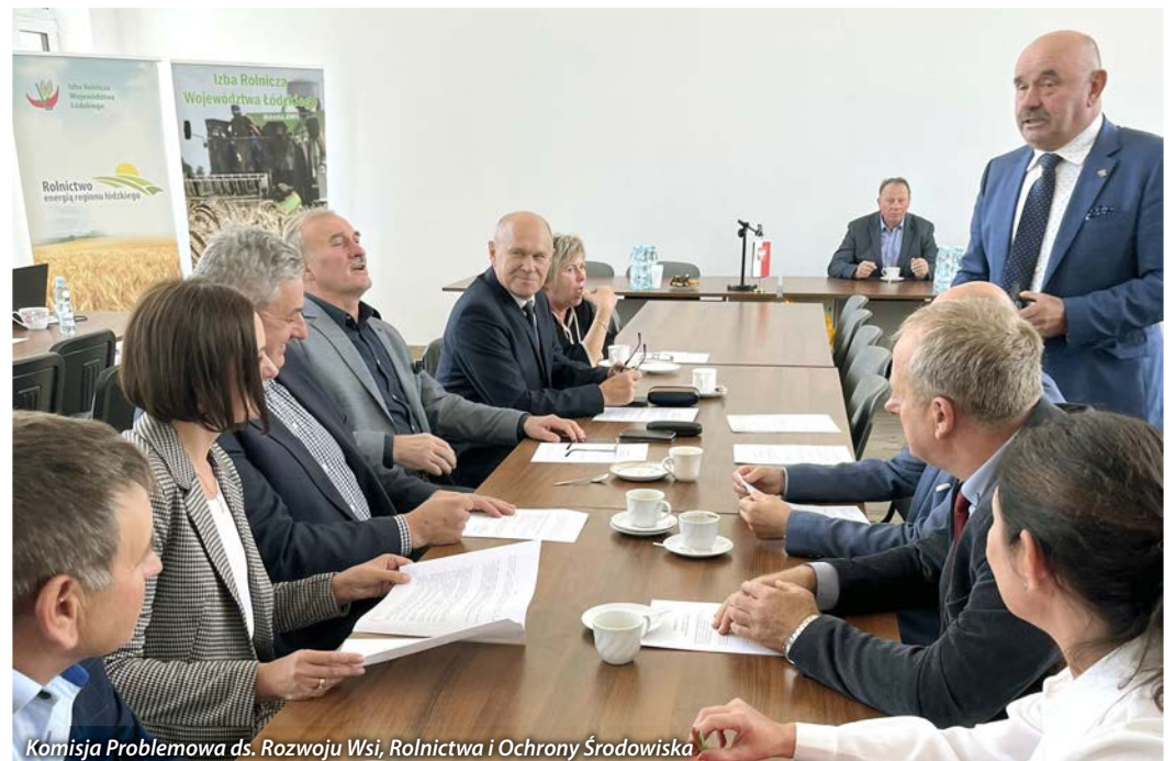
Komisja Problemowa ds. Rozwoju Wsi, Rolnictwa i Ochrony Środowiska

3. Podjąć działania mające na celu ograniczenie biurokracji w gospodarstwach rolnych, duża ilość prowadzenia dokumentów wiąże się z ograniczonym czasem dla prac gospodarczych.