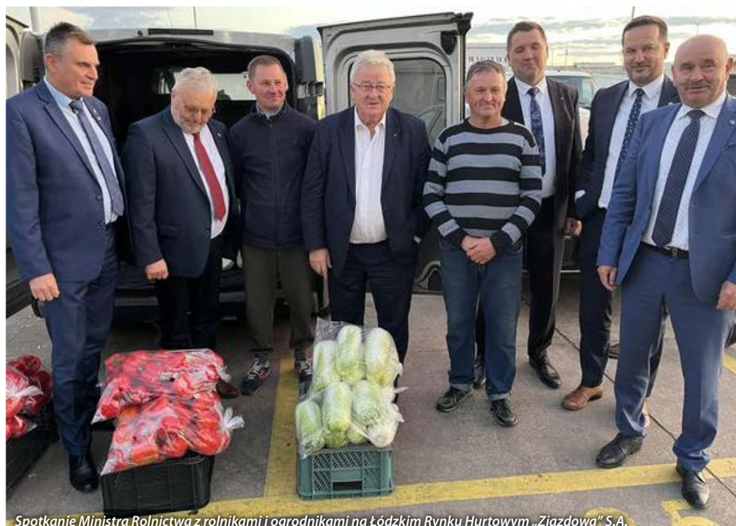
Spotkanie Ministra Rolnictwa z rolnikami i ogrodnikami na Łódzkim Rynku Hurtowym „Zjazdowa” S.A.

3. Podjąć działania mające na celu poprawę działania aplikacji suszowej i umożliwienie dokonywania korekty podczas redagowania w aplikacji suszowej oraz dokonywania poprawek, korygowania wprowadzo-