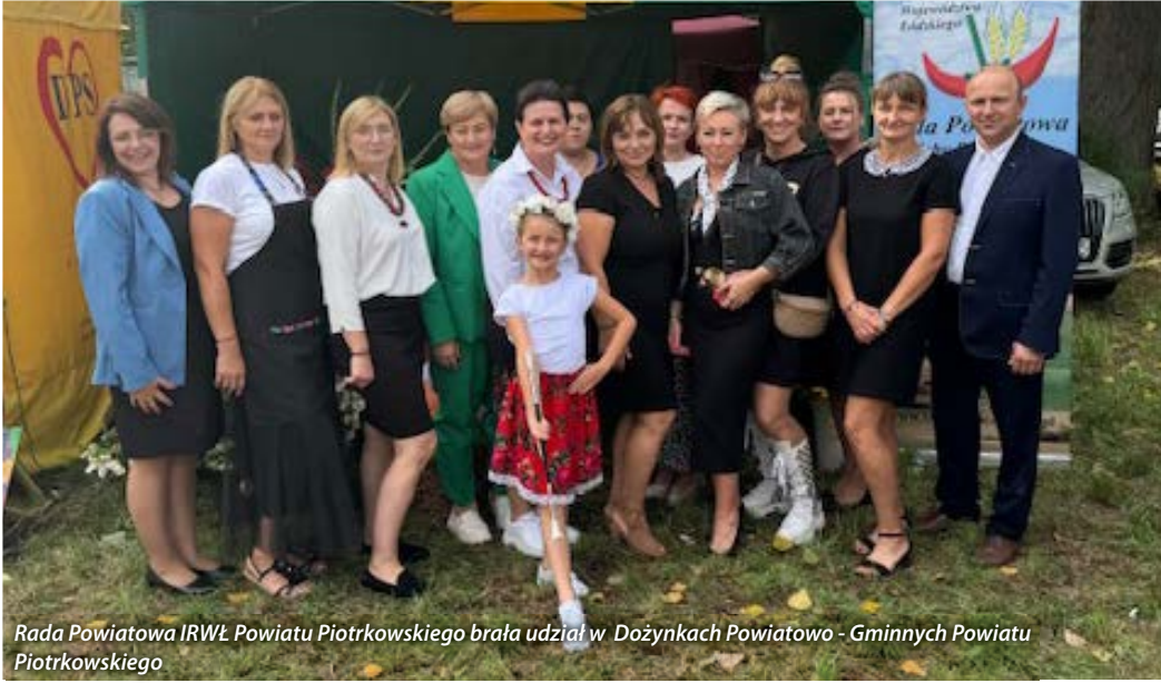
Rada Powiatowa IRWŁ Powiatu Piotrkowskiego brała udział w Dożynkach Powiatowo - Gminnych Powiatu Piotrkowskiego