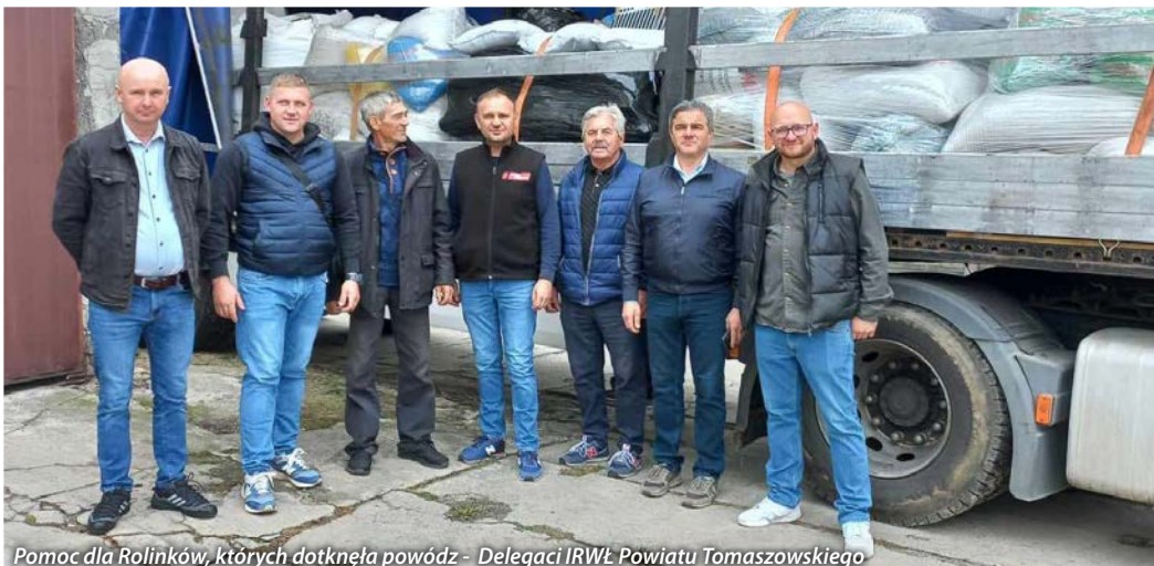
Pomoc dla Rolników, których dotknęła powódź - Delegaci IRWŁ Powiatu Tomaszowskiego