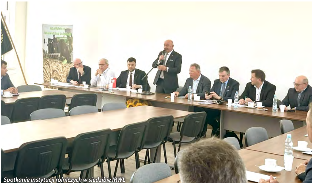
Spotkanie instytucji rolniczych w siedzibie IRWŁ

i ewidencjach prowadzonych na podstawie odrębnych przepisów;