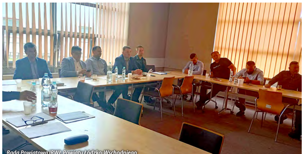
Rada Powiatowa IRWŁ Powiatu Łódzko-Wschodniego

W omawianym okresie odbyły się 2 posiedzenia Rad Powiatowych IRWŁ (w dniu 15.05.2024r. powiatu łaskiego i w dniu 23.05.2024r. powiatu łódzkiego-wschodniego) podczas których członkowie Rady Powiatowej omówili m.in. trudną sytuację w rolnictwie