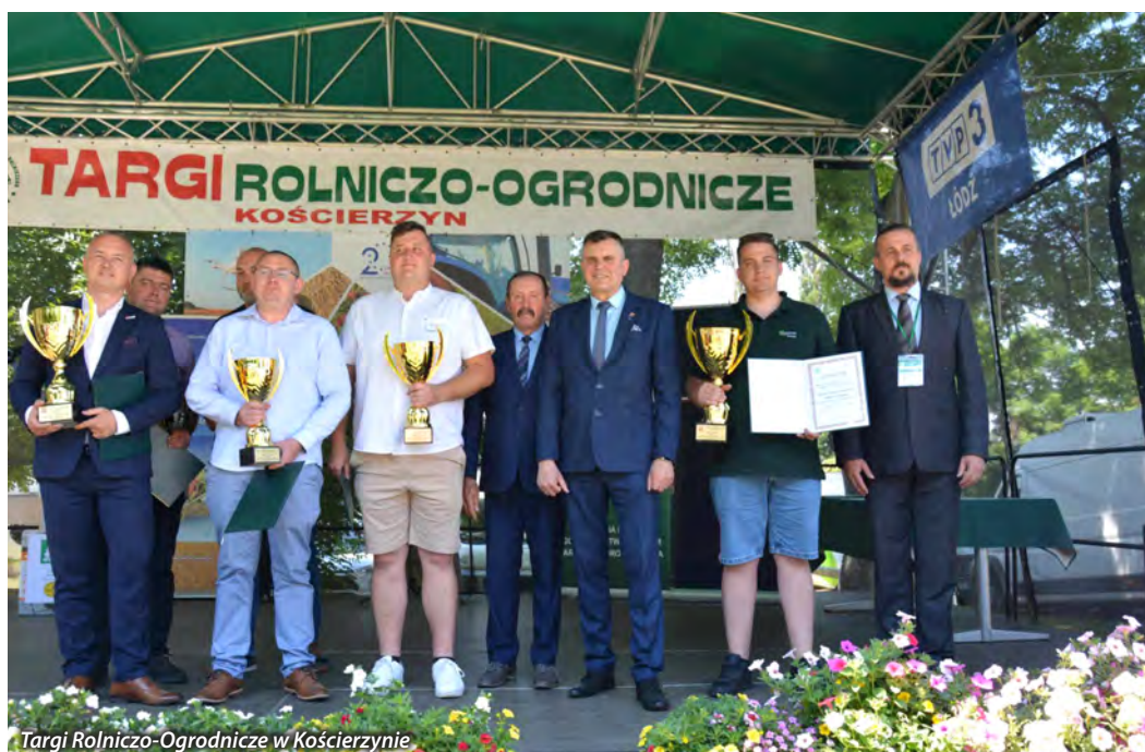
Targi Rolniczo-Ogrodnicze w Kościerzynie

a przedstawiciele instytucji sektora rolnego obecni na posiedzeniach przedstawili najważniejsze informacje dla producentów rolnych m.in. na temat szkód wyrządzanych przez gatunki chronione. Podjęte wnioski zostały przekazane do rozpatrzenia do Zarządu IRWŁ.