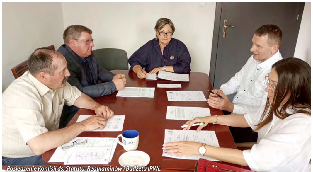
Posiedzenie Komisji ds. Statutu, Regulaminów i Budżetu IRWŁ

W dniu 21.05.2024r. odbyło się kolejne posiedzenie Zarządu Izby Rolniczej Województwa Łódzkiego połączonego ze spotkaniem z udziałem Wicewojewody Łódzkiego i przedstawicieli instytucji sektora rolnego. W trakcie spotkania poruszono między innymi takie tematy jak: kwestie dopłat do zbóż, ubezpieczeń trzody chlewnej, warzyw i owoców (przymrozków wiosennych i suszy), problemy ze zbytem zbóż w związku z napływem ukraińskiego zboża na rynek polski, odstrzałem sanitarnym dzików, ASF, dofinansowania do fotowoltaiki dla rolników. Zaproszeni przedstawiciele poszczególnych jednostek przybliżyli realizowane przez siebie zadania, a także omówili obecną sytuację w rolnictwie na szczeblu województwa oraz kraju.