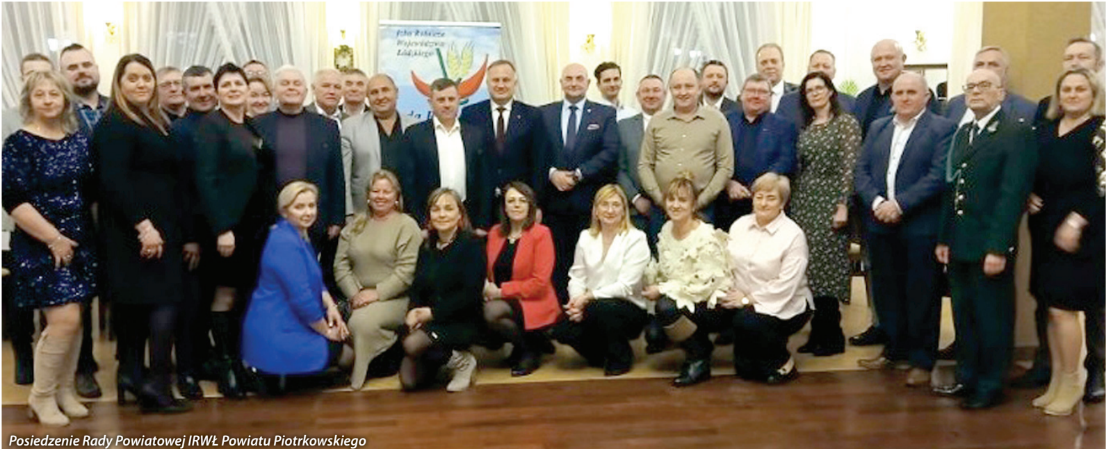
Posiedzenie Rady Powiatowej IRWŁ Powiatu Piotrkowskiego