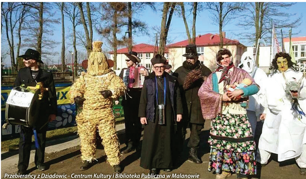
Przebierańcy z Dziadowic - Centrum Kultury i Biblioteka Publiczna w Malanowie

Dziś te niezwykle barwne imprezy sportowe trwają często nawet 2 miesiące, w okresie karnawału, skupiając wokół siebie nie tylko górali-koniarzy, lecz także sporo turystów. W trakcie wyścigu zawodnicy mają do pokonania tor o długości od 800 do 1400 metrów. Zaprzęgiem powozi mężczyzna nazywany kumotrem, drugą osobą w parze jest kobieta zwana kumotką, która poprzez balans ciałem ma za zadanie stabilizować tor jazdy i nie dopuścić do wywrotki. Obecnie w czasie karnawału rywalizację kumoterek można