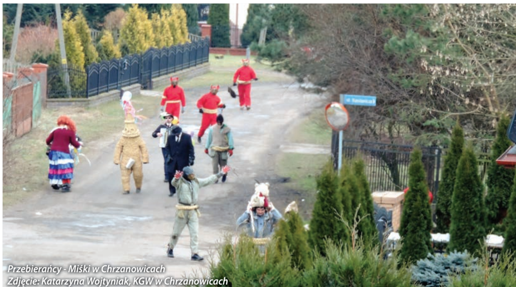
Przebierańcy - Miśki w Chrzanowicach

Comber to wywodząca się ze średniowiecza ludowa zabawa zapustna, która dawniej odbywała się w różnych regionach Polski. Według jednej z teorii, zwyczaj pochodzi z Krakowa, a według innej, że trafił na ziemię polskie za sprawą osadników niemieckich. Tradycja spotkań