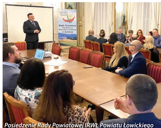
Posiedzenie Rady Powiatowej IRWŁ Powiatu Łowickiego

W dniu 20.01.2025r. w Auli Kryształowej Szkoły Głównej Gospodarstwa Wiejskiego w Warszawie przedstawiciele łódzkiego samorządu rolniczego uczestniczyli w podsumowaniu spotkań Ministra Rolnictwa i Rozwoju Wsi z 16 izbami rolniczymi. Zakończył się pierwszy etap konsultacji najważniejszych dla rolników tematów. Minister Rolnictwa i Rozwoju Wsi - Czesław Siekierski chciałby tę formułę debaty z Izbami Rolniczymi, Agencjami, Inspekcjami i innymi podmiotami reprezentującymi środowiska rolnicze kontynuować w kolejnych latach. Podczas spotkania poruszono kwestię definicji aktywnego rolnika, ustawy o dzierżawie ziemi oraz umowy MERCOSUR. Szef resortu rolnictwa zapewnił, że wszystkie uwagi rolników, zebrane wcześniej w terenie oraz zgłaszane podczas spotkania w auli SGGW,