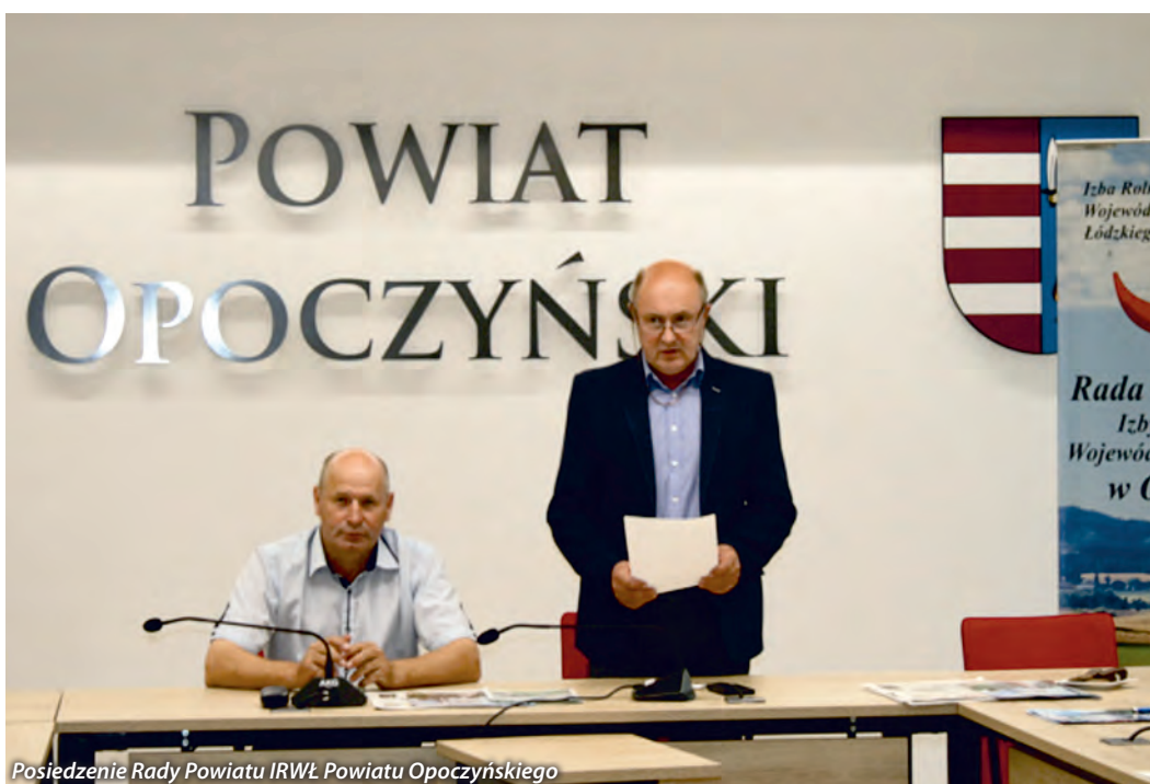
Posiedzenie Rady Powiatu IRWŁ Powiatu Opoczyńskiego