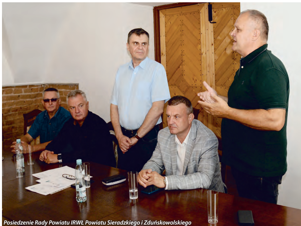
Posiedzenie Rady Powiatu IRWŁ Powiatu Sieradzkiego i Zduńskowolskiego