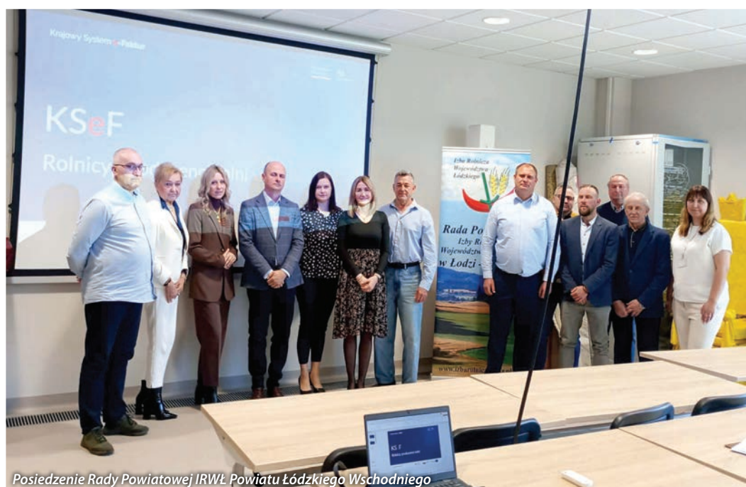
Posiedzenie Rady Powiatowej IRWŁ Powiatu Łódzkiego Wschodniego