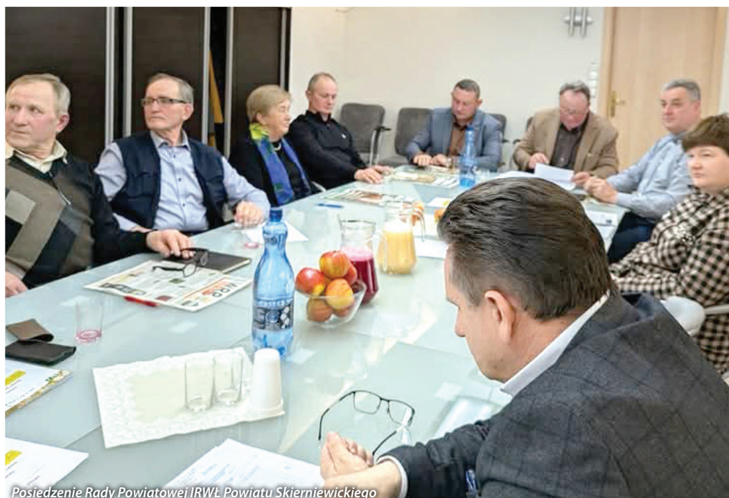
Posiedzenie Rady Powiatowej IRWŁ Powiatu Skierniewickiego

• 16 kwietnia 2026 roku w Górcie Pabianickiej odbyło się szkolenie przygotowane przez ŁODR zś. w Bratoszewicach poświęcone ekoschematom –