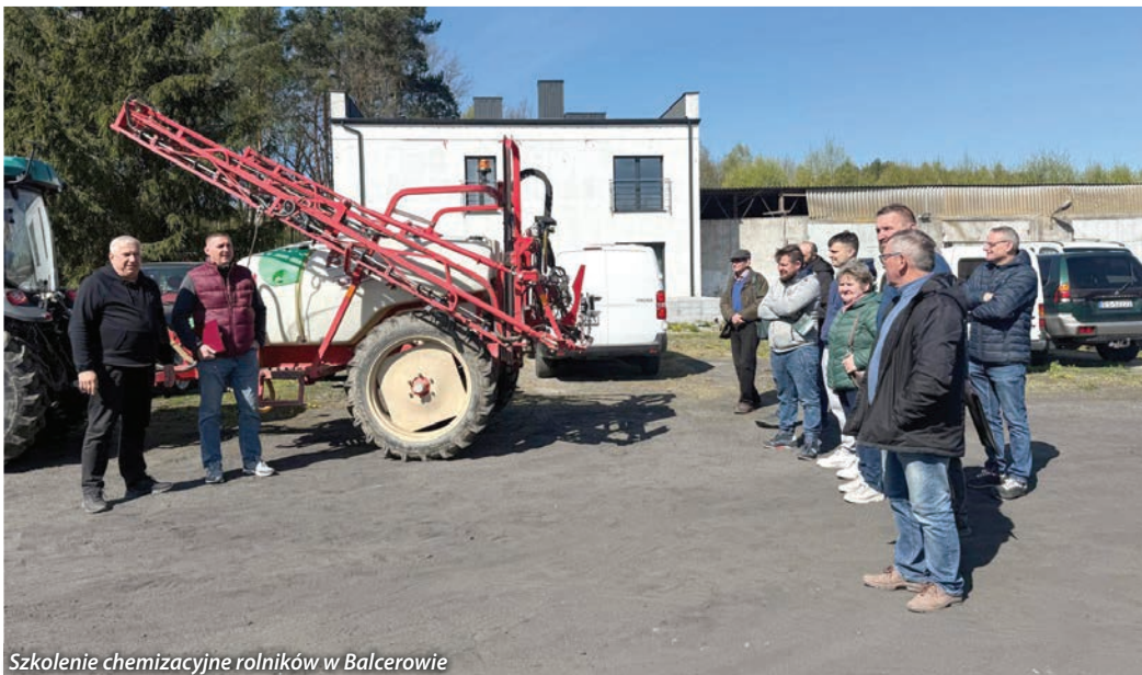
Szkolenie chemizacyjne rolników w Balcerowie