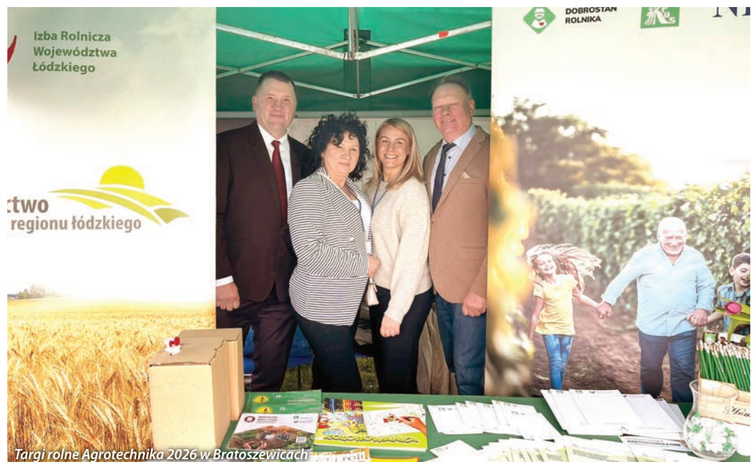
Targi rolne Agrotechnika 2026 w Bratoszewicach

• 26 kwietnia 2026 roku w Bratoszewicach odbyła się wiosenna edycja Targów Rolnych AGROTECHNIKA 2026, która przyciągnęła licznych rolników, wystawców oraz miłośników wsi. Wydarzenie było doskonałą okazją do zapoznania się z nowoczesnymi rozwiązaniami w rolnictwie, ofertą produktów lokalnych oraz działalnością Kół Gospodyń Wiejskich. Targi sprzyjały również wymianie doświadczeń, integracji środowiska rolniczego oraz bezpośrednim konsultacjom z doradcami, potwierdzając swoją istotną rolę w rozwoju rolnictwa w regionie. Dzięki uprzejmości Kasy Rolniczego Ubezpieczenia Społecznego