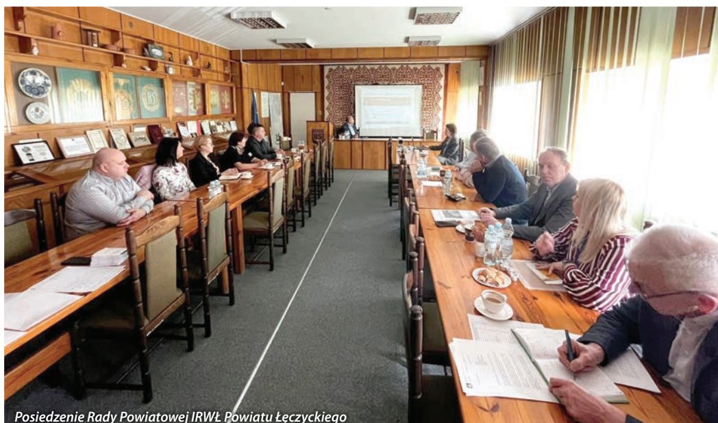
Posiedzenie Rady Powiatowej IRWŁ Powiatu Łęczyckiego