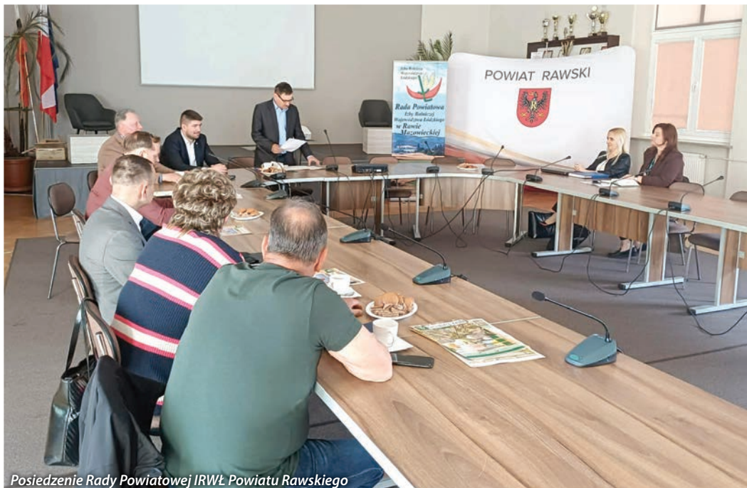
Posiedzenie Rady Powiatowej IRWŁ Powiatu Rawskiego