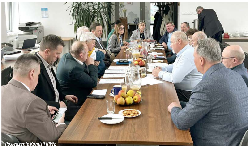
Posiedzenie Komisji IRWŁ